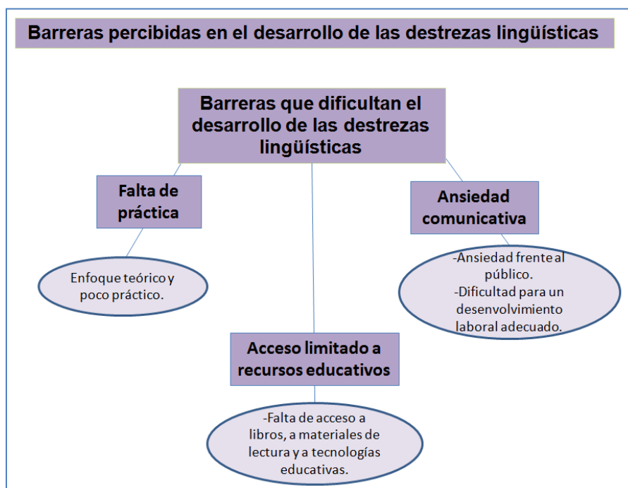
Figura 2: Barreras percibidas en el desarrollo de las destrezas lingüísticas. Elaboración: Los autores.