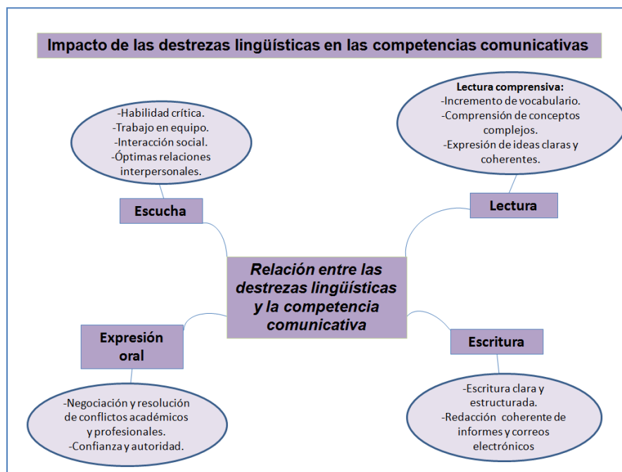
Figura 3: Relación entre las destrezas lingüísticas y la competencia comunicativa. Elaboración: Los autores.

Los participantes indicaron que sus destrezas lingüísticas juegan un papel fundamental en la mejora de sus competencias comunicativas , especialmente en su capacidad para interactuar de manera efectiva en diferentes contextos. A continuación, se presenta un resumen de cómo cada destreza influye en la competencia comunicativa: